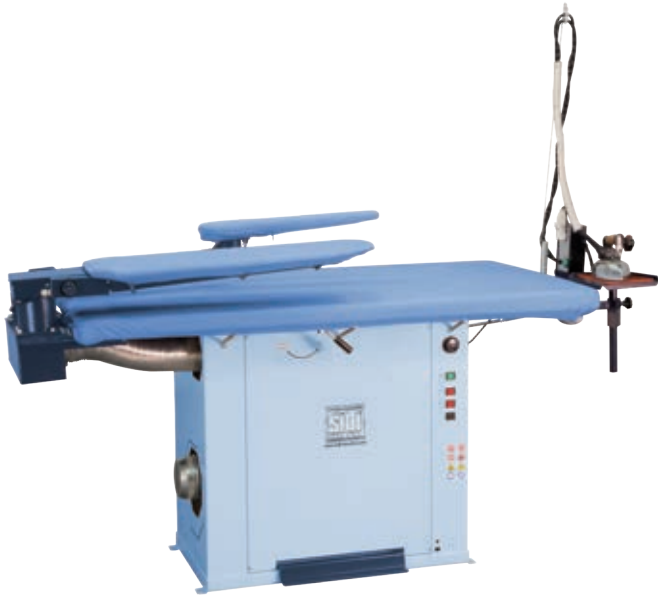
SPA Maxi +F3+F9